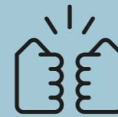
Abbildung von Erfolgsfaktoren und des Risikoappetits